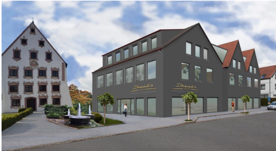
(Illustration aus Sicht des Eigentümers)